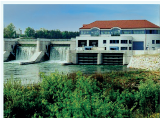
Laufkraftwerk Lambach (Traun)

Strom für unser Produkt „ENAMO Ökostrom UZ 46“ wird in folgenden Kraftwerken unter Berücksichtigung der strengen Anforderungen des Umweltzeichens produziert: