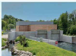
Wasserkraftwerk Stadl-Paura (Traun)