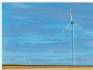
Windparks aus Ober- und Niederösterreich